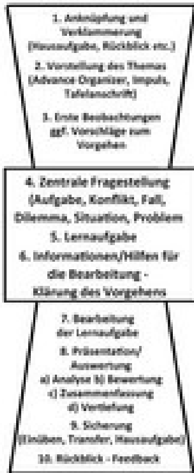
Abb. 4 Eigener Entwurf

vermeiden und statt dessen Üben und Wiederholen in lebensbedeutsame Kontexte einzubinden. Dazu eignen sich vor allem Transferaufgaben mit religiösen und ethischen Implikationen, die Vernetzungen mit bereits Bekanntem und Gekanntem ermöglichen.