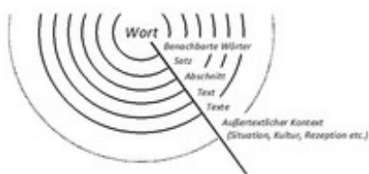
Abb. 4 Dimensionsmodell des sprachlichen Kontextes

(Situation, Kultur bis hin zum Rezeptionszusammenhang) beschreibt (Scott/Tribble, 2006, 3-10). Gerade an diesen Schnittstellen wird deutlich, wo Übergänge zu anderen sprachanalytischen aber auch sozialempririschen Herangehensweisen bestehen: Eine Korpusanalyse lässt sich je nach Fragestellung mit diskursanalytischen (→ Diskursanalyse ), hermeneutischen (→ Hermeneutik ) wie auch sozialempririschen Herangehensweisen (→ Forschungsmethoden, religionspädagogische ) triangulieren (Baker, 2006, 2010; Mahlberg, 2014).