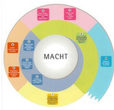
Abb. 6 Spirale Macht.

Im Blick auf den kumulativen Kompetenzaufbau liegt noch ein weiter Weg vor der Religionspädagogik. Er kann hier nur in Stichworten angedeutet werden. Notwendig erscheinen: