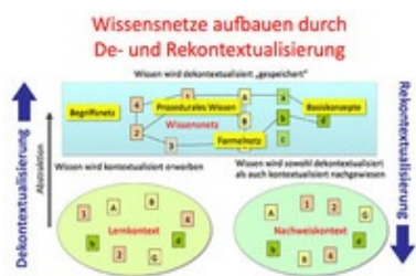
Abb. 3 Dekontextualisierung und Rekontextualisierung beim Wissenserwerb.

Wie ein solcher Prozess abläuft, erläutert Josef Leisen mit einem Modell: