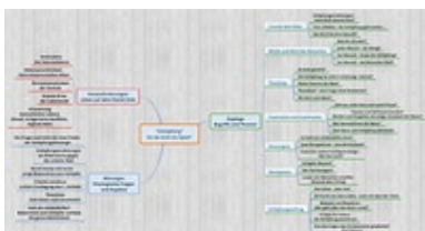
Abb. 4 Didaktische Entfaltung des

Am Beispiel des Unterrichtsthemas „Schöpfung – ist da Gott im Spiel?“ lässt sich veranschaulichen, wie ein theologischer Leitbegriff religionspädagogisch entfaltet werden kann. Dabei zeigt die Mindmap zum einen, dass das Reden von Gott dem Schöpfer eingebunden ist in Herausforderungen, die mit dem Leben auf diesem Planeten Erde schon immer, aber insbesondere aktuell und zukünftig gegeben sind. Zum anderen markiert sie einige theologisch zentrale Probleme, die bei der didaktischen Erschließung zu berücksichtigen sind. Und schließlich beschreibt sie ein fachspezifisches Begriffsnetz, dem mögliche Themen des Religionsunterrichts auf unterschiedlichen Stufen zugeordnet werden. Damit wird deutlich, welche vielfältigen Anknüpfungspunkte und Vernetzungen bei dem Thema möglich sind, statt den Fokus – wie oft üblich – auf das Verhältnis von Naturwissenschaften und Glaube zu legen (→ Schöpfung ) (vgl. Kliemann/Schweitzer, 2018).