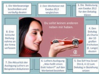
Abb. 5 Kompetenzwerb an einer Werbeanzeige

Anforderungssituationen ist von Obst/Lenhard (vgl. 2015) ausführlich beschrieben und inzwischen vielfach rezipiert worden. Geht man davon aus, dass Wissen und Können (nicht nur, aber vorwiegend!) in der Auseinandersetzung mit konkreten Herausforderungen erworben werden, so mag das folgende Beispiel zeigen, wie eine Anforderungssituation mit einer Reihe von Operationen verknüpft werden kann, die es ermöglichen, fachspezifische Teilkompetenzen auf der inhaltlichen und prozessualen Ebene zu erwerben. Hinzuweisen ist darauf, dass dem Werbebild im Original eine Anzeige eines namhaften Automobilherstellers zugrunde liegt.