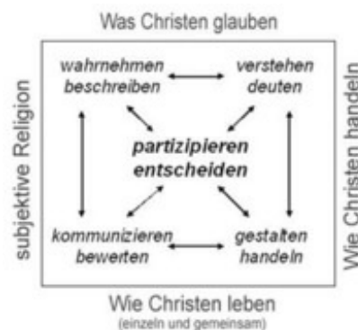
Abb. 4 Kompetenzstrukturmodell katechetischen Lernens (Scheidler, 2011c, 99).

Dieses theoretisch-programmatische Kompetenzmodell der Katechese kann eine orientierende Funktion für katechetische Lernwege mit Teilnehmenden erfüllen, die lernen wollen, aus ihrer Taufberufung zu leben. Empirische Untersuchungen dazu, was tatsächlich von Menschen gelernt wird, die an katechetischen Angeboten teilnehmen, können dazu beitragen, die theoretischen Überlegungen so zu redimensionieren, dass die Praxis weder programmatisch überfordert noch durch pauschale Einschätzungen abgewertet wird. Erwachsene, Jugendliche und Kinder, die mit sekundären Motivationen an katechetischen Wegen teilnehmen, kann dieses Kompetenzmodell überfordern. Zur Entlastung der Katecheten, die Gruppen mit sekundär motivierten Teilnehmenden begleiten, liegt es nahe, die Förderung der Wahrnehmungsfähigkeit als Voraussetzung und Ziel des Lernprozesses ins Zentrum zu stellen. Derart fokussierte (aber nicht reduzierte!) Lernwege entsprechen zwar von der Sache her nicht dem Kernanliegen katechetischer Wege, ermöglichen aber durchaus wichtige Lernschritte im Vorfeld und im Sinne der Erstverkündigung, so dass sekundär motivierte Teilnehmende nicht abgewiesen werden müssen und diejenigen, die mehr wollen, auch auf den Glauben bezogene Fähigkeiten der Partizipation, der Entscheidung, der Gestaltung von Lebenssituationen und des Handelns im persönlichen, kirchlichen und beruflichen Kontext weiter entwickeln können (Scheidler, 2012, 168f.).