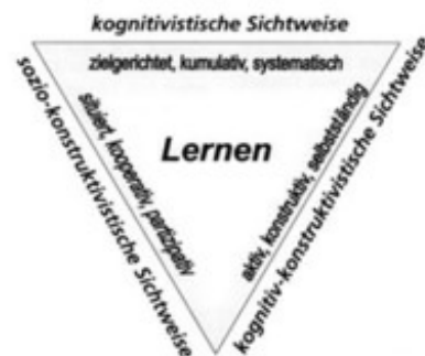
Abb. 3 Kernelemente des Lehren und Lernens (nach Weinert) (Hasselhorn/Gold, 2006, 237)

Weil lebendige Erfahrungen mit und in christlicher Überzeugungsgemeinschaft elementar sind für die Weitergabe christlichen Lebens- und Glaubenswissens, ist die sozio-konstruktivistische Lehr-Lernkonzeption, die kognitiv-konstruktivistische Sichtweisen der Lernwege Einzelner einschließt,