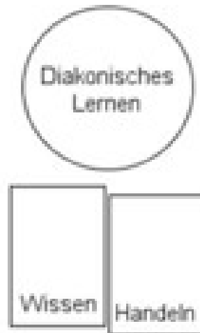
Die zwei Beine des Diakonischen Lernens (2015). Aus: Fricke/Dorner, 2015, S. 15.