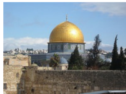
Abb. 1 Felsendom und Tempelberg:

Am Beispiel der Erzählungen um die Erzeltern Abraham und Sara kann Erzählen allgemein als Grundform individueller und kollektiver Identitätsbildung und spezifisch als Grundform jüdisch-christlicher Traditionsbildung in den