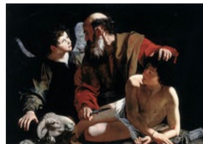
Abb. 7 Opfer Isaaks, Caravaggio (ca. 1597-1599), Lawrenceville