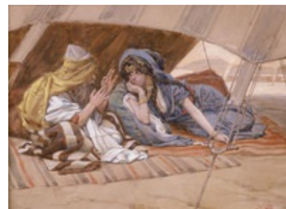
Abb. 3 Abram's Counsel to Sarai, James Jacques Joseph Tissot (ca. 1896-1902), New York