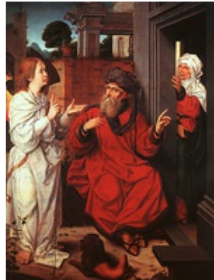
Abb. 5 Abraham, Sara und der Engel, Jan Provost (1520), Paris

Abraham, dessen Glaube an die göttliche Verheißung ihm als Gerechtigkeit angerechnet worden ist ( Gen 15,6 ) und der sich bei JHWH für die Rettung der Gerechten in Sodom und Gomorra eingesetzt hat ( Gen 18,16-33 ), wird schließlich selber auf die Probe gestellt ( Gen 22,1 ): Gott befiehlt ihm, seinen Sohn Isaak auf einem Berg im Land Morija als Opfer darzubringen. Abraham zeigt sich selbst angesichts des Unzumutbaren als der im Glauben Vertrauende . Doch wieder greift ein göttlicher Bote ein. Das Verhalten Abrahams wird als Gottesfurcht gedeutet und die Verheißung der Nachkommen, zahlreich wie die Sterne am Himmel, ein weiteres Mal erneuert ( Gen 22,1-19 ).