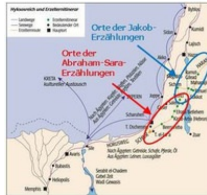
Abb. 6 Karte aus Staubli, 2002

Die Erzählungen sind offen für aktualisierende Fort- und Ausgestaltung auch in nachexilischer Zeit. Umstritten ist, welche Textteile welcher Fortschreibungsstufe zuzuordnen sind. Relative Einigkeit herrscht in Bezug auf die Bestimmung der priesterschriftlichen Anteile. Sie werden gesehen in der genealogischen Hinführung (Toledot Terachs in Gen 11,27 ), den Angaben zum Alter der Figuren und Verwandtschaftsverhältnissen ( Gen 22,20-24 ) einerseits und dem Bundschluss mit Abraham in Gen 17 andererseits.