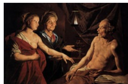
Abb. 4 Sara führt Hagar zu Abraham, Matthias Stom (ca. 1637-1639), Berlin