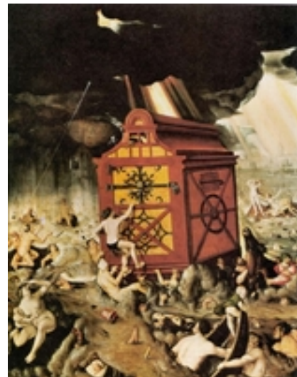
Abb. 2 Die Flut (Hans Baldung; 1516).

Wie auch in den Parallelüberlieferungen aus Mesopotamien markiert die Sintflut das Ende einer ersten Epoche des Menschengeschlechts und den Beginn einer zweiten, die zugleich neue Formen kosmischer und sozialer Ordnung mit sich bringt (Bosshard-Nepustil; → Sintflut / Sintfluterzählung ). Der Niedergang der „ersten“ Welt wird vor allem damit begründet, dass sich in ihr Gewalt in einem Ausmaß ausgebreitet hat, die den Schöpfungsauftrag „seid fruchtbar und mehrt euch“ völlig pervertiert. Wiederum in anthropologischer Zuspitzung ist es vor allem das menschliche Herz, in dem die Quelle dieser destruktiven Kraft gesehen weil, weil dessen „Dichten und Trachten“ nur Böses hervorbringt ( Gen 6,5 ; Gen 8,21 ). Das Neue an der nach-sintflutlichen Welt ist zum einen der → Bund Gottes mit der Schöpfung ( Gen 9,8-17 ), der ihr unverbrüchlichen Bestand gewährt. Dies wird unterstrichen durch die an Noahs Opfer anschließende Festlegung Gottes, wonach nicht