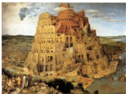
Abb. 3 Der Turmbau zu Babel (Peter Bruegel d. Ä.; 1563).

vergehen sollen „Saat und Ernte, Frost und Hitze, Sommer und Winter, Tag und Nacht“ ( Gen 8,22 ). Neu ist allerdings auch, dass von nun an Gott selbst, nicht etwa nur der Mensch, für den Schutz und die Bewahrung des geschaffenen Lebens sorgen will ( Gen 9,4-6 ).