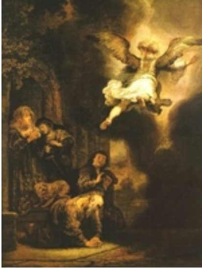
Abb. 3 Rafaels Abschied (Rembrandt; 17. Jh.).

In der abschließenden Selbstoffenbarung in Tob 12 fordert Rafael zum Lobpreis Gottes auf. Nun zeigt sich, dass Rafael nicht erst als Wegbegleiter des Tobias, sondern bereits vorher an der Seite Tobits und Saras gestanden hat. In Rafael zeigt sich für das Buch Tobit also die den Gerechten auf gefahrvollem (Lebens-)Weg begleitende, schützende und heilende Macht Gottes. In seiner Erscheinung auf Erden ist er, der nicht isst und trinkt ( Tob 12,19 [G II : nur „nicht isst“]), für menschliche Augen nicht als Engel erkennbar.