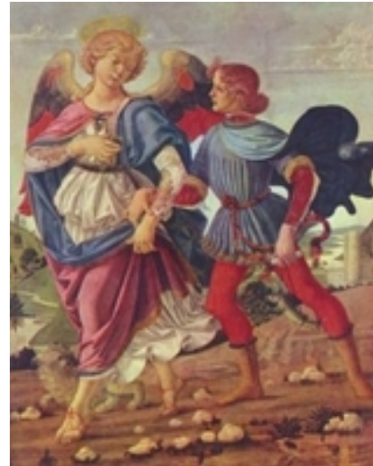
Abb. 2 Rafael und Tobias auf der Reise (Andrea del Verrocchio; 15. Jh.).

unterscheiden. Nach der auch der Einheitsübersetzung zugrunde liegenden Kurzfassung (G I ), findet das Gebet vor der Herrlichkeit des großen Rafael Gehör. Er wird dann (offensichtlich von Gott) gesandt, um beide zu heilen. Diese Aufgabe Rafaels wird in Tob 12,15 noch einmal weiter erklärt (vgl. auch Tob 12,12 ): Rafael ist „einer von den sieben heiligen Engeln, die das Gebet der Heiligen empor tragen und mit ihm vor die Majestät des heiligen Gottes treten.“ In der Langfassung (G II ) wird die vermittelnde Rolle Rafaels zwischen Tobits und Saras Gebeten und Gott nur in Tob 12,12 thematisiert. Das Gebet wird laut Tob 3,16 G II (Lutherbibel: Tob 3,24 ) vor der Herrlichkeit Gottes erhört, worauf es zur Sendung Rafaels kommt. Dem entspricht auch in Tob 12,15 eine etwas andere Aufgabe Rafaels: Dieser ist hier „einer der sieben Engel, die vor der Herrlichkeit des Herrn stehen und (zu ihm) hineingehen.“