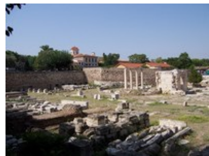
Abb. 4 Athen - Hadriansbibliothek.

ihren Charakter bis in die Spätantike hinein bewahren konnte. Erst die Völkerwanderung im Westen und die islamische Expansion im Osten bedeuteten ihr Ende.