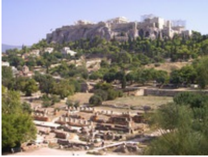
Abb. 1 Athen – Agora (Verwaltungszentrum der Polis); im Hintergrund die Akropolis.