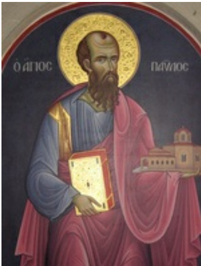
Abb. 9 Paulus von Tarsus (Philippi – Taufkapelle).

Die paulinische Mission war so erfolgreich, dass sie die Grundlage für eine schnelle Ausbreitung des Christentums schuf. Innerhalb weniger Jahre entwickelte sich aus den Anfängen einer traditionell dörflich orientierten Bewegung eine das ganze Römische Reich umspannende Religion, deren Basis die Gemeinden der größeren Städte waren.