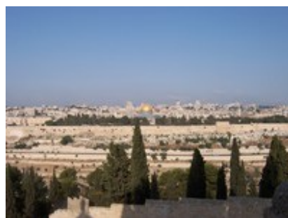
Abb. 10 Jerusalem - Westmauer mit Felsendom.

In der Apostelgeschichte werden – gemäß der programmatischen Ausrichtung auf die Ausbreitung des Evangeliums von Jerusalem über Judäa und Samarien bis „ans Ende der Welt“ ( Apg 1,8 ) – eine ganze Reihe von Städten erwähnt (Jerusalem, Damaskus, Cäsarea, Joppe, Antiochia Syria etc.). Die urchristliche Mission, insbesondere die Mission des Apostels Paulus, konzentrierte sich auf die großen Städte. Die in der Apostelgeschichte überlieferten Missionsreisen berichten von der Predigt des Evangeliums in den Metropolen Kleinasiens (Antiochia Syria, Ephesus etc.) und Griechenlands (Thessaloniki, Beröa, Athen, Korinth). Einige der dort genannten Städte wie Thessaloniki oder Athen waren klassische Poleis und verfügten über Organe städtischer Selbstverwaltung wie Magistrate und Volksversammlung ( Apg 17,5 : politarchoi und demos ; vgl. auch Apg 19,23ff ). Andere wie Antiochia Pisidia, Philippi oder Alexandria Troas (vgl. Apg 13,14 ; Apg 16,12 ; Apg 20,6 ) waren so genannte Kolonien ( coloniae ), Städte römischen Rechts. Das in Apg 21,39 erwähnte Bürgerrecht des Paulus in der kleinasiatischen Polis Tarsus (πόλεως πολίτης / póleōs polítēs ) wird in seinen Briefen nicht erwähnt.