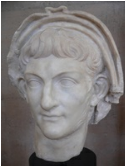
Abb. 3 Kaiser Nero.

Die → römische Herrschaft veränderte die hellenistische Poliskultur und das System der inneren Selbstverwaltung nicht grundlegend, sondern baute darauf auf. Elemente der römischen Herrschaft (→ Kaiserkult etc.) und des römischen Lebens (Thermen, Arena etc.) wurden großzügig aufgenommen und in das bestehende System integriert. Römische Kaiser wie → Nero (54–68 n. Chr.), → Claudius (41–54 n. Chr.) oder → Hadrian (117–138 n. Chr.) zeigten sich als Freunde griechischer Kultur und gewährten einigen Städten großzügige Privilegien.