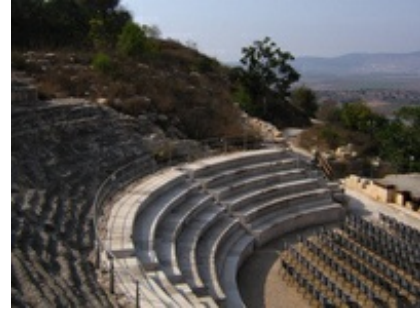
Abb. 8 Sepphoris - Theater.

Paulus , die die Städte Kleinasiens und Griechenlands zum Ziel ihrer Mission machen. Der Kleinasiate Paulus von Tarsus denkt kosmopolitisch – auch wegen der bevorstehenden Parusie. Nur so kann er das Ziel einer raschen Verkündigung des Evangeliums im Osten des Reiches und weiter über Rom bis nach Spanien erreichen (vgl. Röm 15 ). Erste Basis für die Mission ist die Metropole → Antiochia (vgl. Apg 13,1ff ; Apg 14,26 ; Apg 15,35 ; Apg 18,22 ). Von dort aus bereist er die großen Städte Kleinasiens und Griechenlands. Die Existenz einer → Synagoge bzw. einer jüdischen Gemeinde als Anknüpfungspunkt für seine Mission (vgl. z.B. Apg 17,1 ; Apg 18,4 ) dürfte nicht unwichtig gewesen sein, auch wenn sich das aus den Briefen nicht erheben läßt.