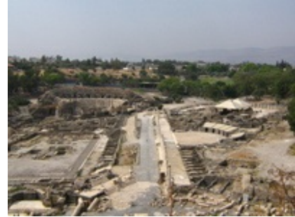
Abb. 6 Das hellenistisch-römische Scythopolis (Beth Shean).

Unter → König Herodes und seinen Söhnen wurden weitere Städte gegründet (→ Caesarea , Tiberias), deren Grundriss und architektonische Ausgestaltung sich am Stil hellenistischer Poleis orientierte. Wie groß der Einfluß des Hellenismus zur Zeit Jesu in Palästina war, zeigt sich an Jerusalem. Selbst hier im Zentrum des Judentums finden sich Tempel und Theater, sogar ein großes Hippodrom als Zeichen hellenistisch-römischer Lebensart und ein rechtwinkliges Straßensystem in den neu angelegten Stadtvierteln der Oberstadt. Abseits der hellenisierten Städte scheint das Leben dagegen in traditionellen Bahnen verlaufen zu sein. Das gilt insbesondere für die Dörfer Galiläas, in denen sich die Wirksamkeit Jesu abspielte.