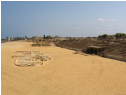
Abb. 7 Caesarea Maritima - Hippodrom.