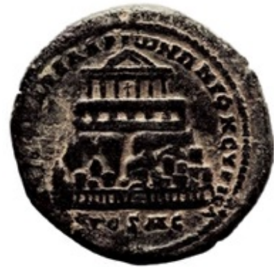
Abb. 9 In Pella geprägte Münze.

Dennoch gibt es durchaus, wenn auch wenige Spuren einer frühromischen Besiedlung auf dem Tell el-Huşn vor dem späten 1. Jh. n. Chr. Historische und numismatische Belege deuten darauf hin, dass es um 82/83 n. Chr. zu bedeutenden wirtschaftlichen und zivilen Aktivitäten kam, als Pella unter dem römischen Kaiser Domitian seine ersten Stadtmünzen prägte. Es sind Wohnhäuser, Thermen sowie ein Odeon nahe der Quelle aus römischer Zeit (ca. 150 n. Chr.) erhalten. Andere für eine römische Stadt typische Bauwerke, wie ein Nymphäum und Forum, sind nur aufgrund von Münzprägungen zu erahnen. Eine solche, geprägt unter Commodus (vermutlich im Jahr 183/184 n. Chr. in Pella), zeigt einen großen Tempel – vermutlich auf dem Tell el-Huşn , von dem bislang allerdings keine archäologischen Reste gefunden wurden. Südlich des Tells wurde ein römischer Meilenstein der von Gerasa nach Pella führenden Straße gefunden.