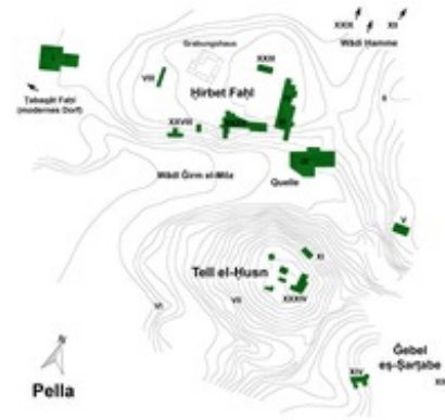
Abb. 3 Plan mit Ausgrabungsarealen.

Die Landschaft rund um das antike Pella ist reich an archäologischen Überresten, die bis in das Altpaläolithikum (Areal XII, ca. 250.000 v. Chr.) zurückreichen. Auf einer Terrasse ca. 1,5 km nördlich der Stadt im Wādi Ḥamme wurden Spuren der Kebaran-Kultur entdeckt, sowie ein Lagerplatz aus dem Natufien erforscht. Der berühmte epipaläolithische Siedlungsplatz Wādi Ḥamme 27 (12.000 Jahre v. Chr.) markiert die erste dauerhafte Siedlung. Danach beginnt sich die Landschaft allmählich mit Siedlungsstätten zu füllen.