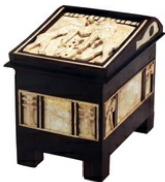
Abb. 4 Rekonstruiertes Kästchen mit Elfenbeintarsien aus der Mittleren Bronzezeit (heute im Jordan Museum, J 15530).

In Ṭabaqāt Faḥil gab es – im Gegensatz zu einigen anderen Stätten in Transjordanien – keinen Bruch zwischen der Mittleren und der Späten Bronzezeit. In beiden Zeiten muss es sich um eine reiche und blühende Stadt mit weitreichenden Handelsbeziehungen bis nach Ägypten und Mesopotamien sowie zum Mittelmeer gehandelt haben, wie die außergewöhnlich gute Bauweise der Häuser sowie zahlreiche Funde nahelegen.