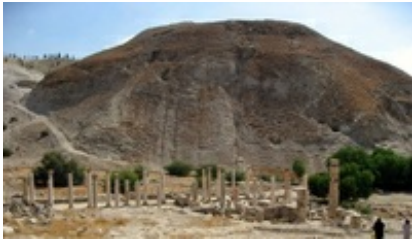
Abb. 8 Byzantinische Basilika im Vordergrund, im Hintergrund Tell el-Huşn mit hellenistischer Stadtmauer.

Arbeiten in Areal XXIII auf dem zentralen Tell haben ein großes und gut ausgestattetes Stadthaus der späthellenistischen Periode mit beträchtlichen Kellerräumen freigelegt. Zu den Funden gehörten rhodische Amphoren, viel Feinkeramik – wie östliche Terra Sigillata-Teller oder Fischteller – und Spindelflaschen ebenso wie eine größere Anzahl von Münzen. Diese Assemblage festigt die Datierung der umfangreichen Zerstörung im frühen 1. Jh. v. Chr. Danach kam es zu einer Unterbrechung der Besiedlung.