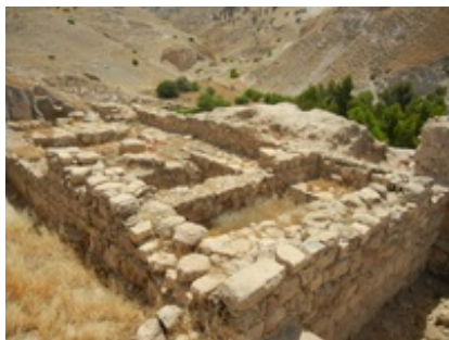
Abb. 6 Spätbronzezeitlicher Tempel.

Aus diesem Tempel stammen sorgsam im Innenraum vergrabene Bauopfer, Votivgaben und weitere Funde. Darunter waren Objekte aus → Fayence , Rohglas und → Glas . Ebenso Perlen verschiedensten Materials, ein Bronze-Arm einer Figurine, eine Schlange aus Kupfer sowie Kultständer, Kelche und Rhyta aus Keramik. Die aufgefundenen Rollsiegel können mehrheitlich dem sog. „Common Style“ der Mitanni-Glyptik zugeordnet werden.