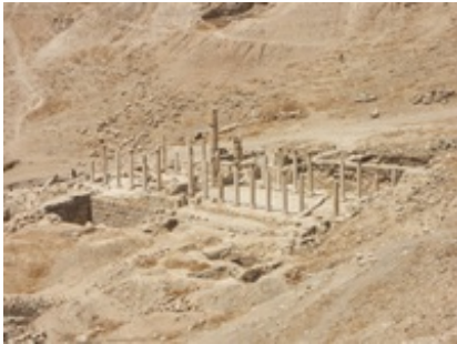
Abb. 10 Byzantinische Hauptkirche.