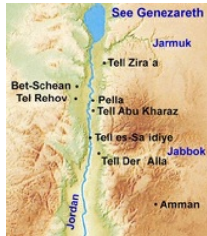
Abb. 1 Karte zur Lage von Pella.

Im Jordantal, am östlichen Rand des modernen Dorfes Ṭabaqāt Faḥil , liegt das antike Pella (Koordinaten: 2078.2064; N 35° 36' 41" , E 32° 27' 02" ). Der archäologisch relevante Bereich wird durch die beiden Erhebungen Chirbet Faḥil (30 m) und Tell el-Ḥuṣn (65 m Höhe) dominiert. Zwischen beiden liegt das Wādi Ġirm el-Mōz sowie eine Quelle. Der Ort besaß viele Vorteile für eine Besiedlung: Er lag an zwei Handelsrouten, nämlich der Nord-Süd-Verbindung, die entlang des Ostufers des → Jordan verläuft, sowie der Ost-West-Verbindung, die von der auf dem transjordanischen Plateau gelegenen Königsstraße hinab in das Jordantal und weiter über Bet-Schean und die → Jesreel-Ebene zur Mittelmeerküste verläuft. Das Pella umgebende Land war hervorragend für Landwirtschaft geeignet. In alttestamentlicher Zeit gehörte der Bereich zu → Gilead .