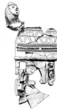
Abb. 7 Kultständer aus Ton.

Aus der Späten Bronzezeit wurde ca. 50 m südöstlich des Tempelareals (in Areal III sowie Teilen von Areal XXXII) eine repräsentative Bebauung gefunden, bei der es sich vermutlich um einen → Palast bzw. ein administratives Zentrum handelt („Governor's Residence“). Dieses bestand aus einem zentralen Hof, der von Vorratsräumen umgeben war, und eine hohe Konzentration von Prestige-Objekten enthielt. Darunter befanden sich z.B. zwei Elfenbeinboxen, Keilschrift-Texte, Lapislazuli- und Goldobjekte zusammen mit zypriotischer und mykenischer Keramik. Es scheint, als sei das Gebäude am Ende des 14. Jh.s v. Chr. aufgegeben worden, als sich die Ägypter aus der Region zurückgezogen haben. Vergleichbare Gebäude wurden in → Bet-Schean , → Geser und → Afek freigelegt.