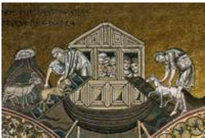
Abb. 3 Das Besteigen der Arche (Mosaik; Kathedrale von Monreale; ca. 1180).

In der Schöpfungserzählung von Gen 1,1-2,4a wird der gute Anfang beschworen und der von Gott dem Menschen übergebene segensreiche Lebensraum entworfen, in dem der Mensch als Verantwortung tragender und zu dieser fähiger Stellvertreter Gottes agiert. Doch die menschliche Erfahrung von Welt ist eine andere: Die von Gott gut konzipierte Schöpfung droht angesichts des bösen und gewaltsamen Handelns der Menschen wieder in ein → Chaos zurückzusinken. Die Erfahrung des Menschen wird in der Erzählung von der Sintflut aus der göttlichen Perspektive geschildert. Der universal gedachte Kontext und die Komplementarität von Schöpfungs- und Sintfluterzählung innerhalb der Urgeschichte ( Gen 1-9 ) machen Noah, der natürlich nicht als historische Person zu verstehen ist, zum exemplarischen Menschen und Repräsentanten der Menschheit.