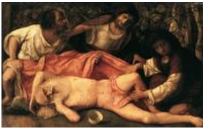
Abb. 7 Noahs Trunkenheit (Giovanni Bellini; ca. 1515).

Noah gilt als „Kulturbringer“, als Acker- und Weinbauer ( Gen 9,20 ; vgl. auch 11QapGen XII,13ff und Jub 7,1-12), der entsprechend der göttlichen Zusage, die den ständigen Wechsel von Aussaat und Ernte auf der Erde garantiert ( Gen 8,22 ), den Ackerboden bebaut. Dies bewahrt ihn jedoch nicht davor, dass ihm das Kulturgut → Wein zum Verhängnis wird. Gen 9,20-27 erzählen, dass er in betrunkenem Zustand nackt in seinem Zelt liegt. Ham, der