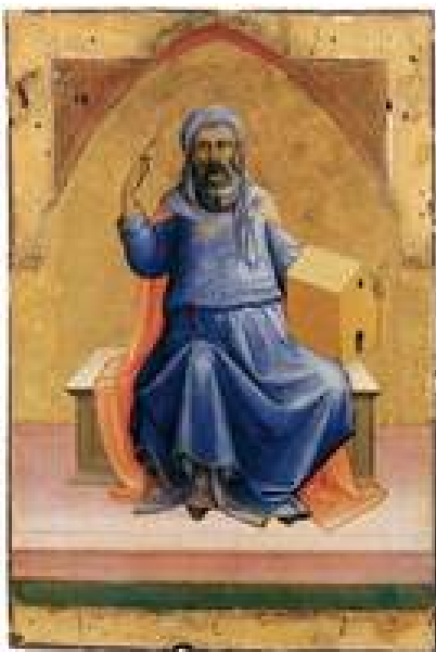
Abb. 1 Noah mit Arche (Monaco Lorenzo; 1408-1410).

Bei dem Namen Noah (hebräisch: נֹחַ noah ; griechisch: Νωε Nōe ) handelt es sich vermutlich um die Kurzform eines Namens, der auf die Wurzel נָח NWH „sich niederlassen / ruhen“ zurückgeht und zu dem in der Langform die Bezeichnung einer Gottheit oder des Kindes gehört, also: „[die Gottheit oder das Kind] ist ruhig / beruhigt“ oder „beruhige dich, [o Gott]“ (vgl. Gesenius, 18. Aufl.). Dafür sprechen akkadische Parallelen, z.B. Ne-ḫi-lum „Gott ist beruhigt“, Nu-úḫ-ilum „Beruhige dich, Gott“ und Nu-ḫi-Eštar „Beruhige dich, Eštar“ (vgl. AHW II, 716).