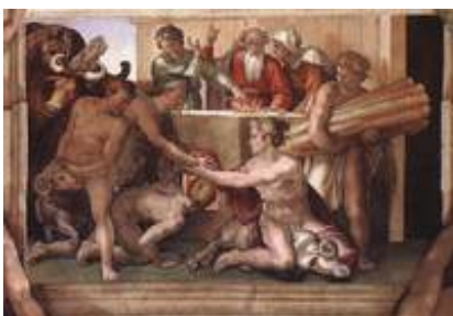
Abb. 5 Noahs Opfer (Fresco; Michelangelo; Sixtinische Kapelle; 1509).

In Noah fallen Existenz aus dem Wort Gottes und verantwortlicher Eigenstand zusammen. Aus eigenem Antrieb baut er für JHWH einen Altar, um ihm ein Opfer darzubringen, dessen Geruch JHWH im Selbstgespräch seinen universalen Rettungswillen formulieren lässt: Nie wieder soll die Erde verflucht werden, auch wenn die Möglichkeit zu menschlicher Boshaftigkeit immer gegeben ist ( Gen 8,21 ). Der Namensdeutung des Lamech entsprechend wird die Verfluchung des