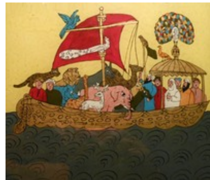
Abb. 8 Noah in der Arche (anonyme Hinterglasmalerei aus Tunesien; 20. Jh.).

Im Koran wird die Vorbildhaftigkeit Noahs herausgestellt, der als Gottesgesandter als Präfiguration Muhammads gilt. Er ist geschickt als „eindringlicher Warner“ die Menschen zu bewegen, sich dem einen Gott zuzuwenden (Sure 11,25; vgl. Sure 17 und 26; Text Koran ). Ursache für das göttliche Strafgericht ist die Anbetung der anderen Götter. Die Noah Schmähenden verlangen die Realisierung der Androhung als Beweis der Glaubwürdigkeit Noahs (Sure 11,32). Als es zum Strafgericht kommt, bittet Noah für seinen Sohn, der nicht auf Gott, sondern auf seine eigene Kraft vertraute (Sure 11,45). Kriterium der Gerechtigkeit ist die Hinwendung zu Gott, so die Botschaft inmitten der Ungläubigen, die sich der Lehre entziehen. An der Sintfluterzählung wird gezeigt, dass der Glaube über das Heil entscheidet und die Getreuen gerettet werden.