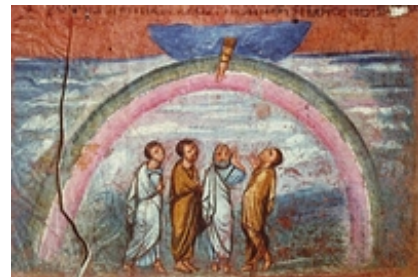
Abb. 6 Der Noah-Bund (Wiener Genesishandschrift; 6. Jh.).

Mit Noah, seinen Söhnen und allen Lebewesen schließt Gott einen universalen → Bund (auch Noah-Bund oder noachitischer Bund genannt), der in dem Bogen (→ Wetterphänomene, theol. Bedeutung ) als Zeichen sichtbar wird ( Gen 9,10-17 ). Dieser Bund besteht ohne menschliche Vorleistungen und ist in den Personen von Noah und seinen Söhnen ( Gen 9,8 ) – die Frauen bleiben unerwähnt – und im Kontext der Urgeschichte als Menschheitsbund „für alle kommenden Generationen“ ( Gen 9,12 ) zu verstehen. In der Bundesformulierung Gottes kommt die Hoffnung zum Ausdruck, dass das uranfängliche Chaos in Form der lebensbedrohenden Wasser der Flut „nie wieder“ die Ordnung zwischen Gott und Mensch gefährden soll. Sie kommt einer Selbstverpflichtung Gottes gleich, an die er durch den Bogen erinnert wird. Aus menschlicher Perspektive ist der Bogen Zeichen der ewigen Zusage Gottes, Leben zu erhalten, aus der der Mensch durch sein Handeln nicht herausfallen kann.