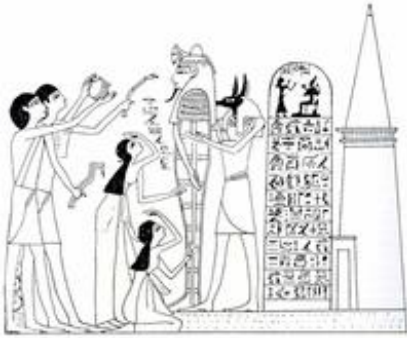
Abb. 1 Mundöffnungsritual an der vor dem Grab aufgerichteten Mumie (Totenpapyrus des Hunefer; 19. Dynastie).

religiösen Vorstellungen. Danach ist der Tod nicht das Ende des Lebens, sondern der Übergang in eine jenseitige Existenz. Diese ist jedoch an die Unversehrtheit des Körpers gebunden: Die Seele, die den Körper beim Tod verlassen hat, kehrt nach den Bestattungsritualen in ihn zurück. Für ein ewiges Leben im Jenseits war die Wiedervereinigung von Körper und Seele Voraussetzung. Durch das Ritual der Mundöffnung, das vor dem Grab an der aufgerichteten Mumie durchgeführt wurde, erhielt der Körper das Leben zurück, er