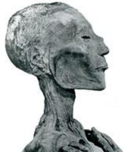
Abb. 4 Mumie Ramses' V. (1145-1142 v. Chr.). Am Gesicht zeigt sich deutlich eine Hautkrankheit, deren Ursache bisher noch nicht diagnostiziert werden konnte.

Balsamierungstechnik mit Natron und harzigen Salbölen wurde mit nur geringen Abweichungen in Bezug auf einzubringende Füllmaterialien wie Leinen oder Sägespäne bis in die römische Zeit beibehalten. Besonders in der 21. Dynastie und Spätzeit stopften die Balsamierer die von den Eingeweiden entleerten Körper sehr stark mit Sägespänen aromatisch duftender Hölzer aus, um ein möglichst lebensgetreues Aussehen der Mumien zu erreichen. Dies geschah auch im Mundbereich, damit das eingefallene Gesicht fülliger und damit lebendiger aussah. Dem gleichen Zweck diente das Auflegen von Augen aus Fayence auf die Lider, damit der Verstorbene im Jenseits wieder sehen konnte. Aromatisch duftende Substanzen unterstützen die Wiederbelebung des Toten, und so finden wir Wacholderbeeren, duftende Flechten oder auch Zwiebeln an Mumien.