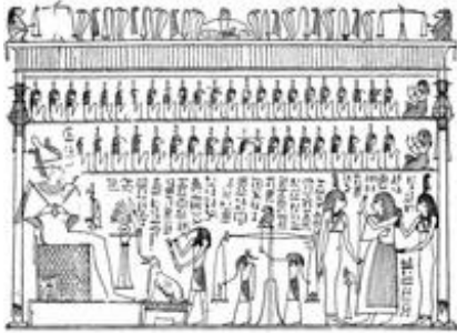
Abb. 3 Totengericht vor Osiris (ptolemäisch). Anubis und Horus wiegen das Herz des Verstorbenen, der von zwei Göttinnen geleitet wird, gegen die Feder der Maat; Thot verzeichnet das Ergebnis.

meist den Totenbuch-Spruch 125, das negative Sündenbekenntnis, in dem bekundet wird, keine der vielen möglichen Verfehlungen begangen zu haben (→ Totenbuch ; → Jenseitsvorstellungen in Ägypten 2.2.3. und 6.2.; → Unterweltvorstellungen und Jenseitsliteratur in Ägypten 2.3.1.). Diesen Text musste der Verstorbene vor dem Totenrichter Osiris sprechen und dadurch ein sündenfreies Leben dokumentieren. Im Verlauf dieser Prüfung wird auch sein Herz gegen die → Maat , Göttin der Wahrheit, in Form einer Feder dargestellt, auf einer Standwaage