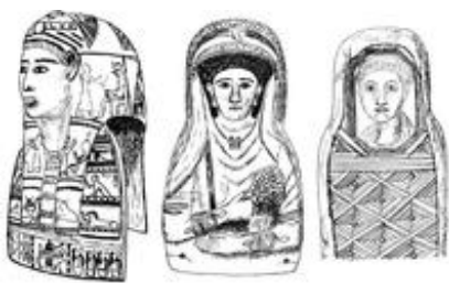
Abb. 7 Drei Darstellungsarten des Verstorbenen in römischer Zeit, als verkörperter Osiris, in der reichen Tracht der Lebenden und auf einem Mumienporträt.

In römischer Zeit verändert sich die Ausführung der Mumienhüllung sehr stark: Die Leinenbinden werden in kunstvolle Muster einer Kassettenwicklung gelegt, in deren Mitte ein vergoldeter Gipsknopf sitzt. Die Kopfparten von Mumien werden regional unterschiedlich behandelt. Neben der klassischen ägyptischen Form, die den Verstorbenen idealisiert als Osiris zeigt, gibt es Kartonagemasken, die den Verstorbenen mit aufwendiger modischer Frisur und reichlich