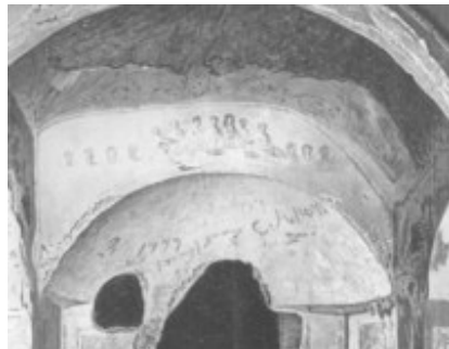
Abb. 4 Christliches Sigma-Mahl, Capella greca, Priscilla-Katakombe, Rom, 2./3. Jh.