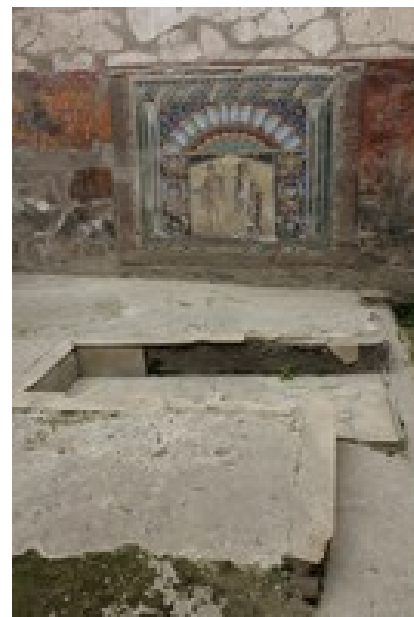
Abb. 1 Freiluft- triklinium mit Mosaiken im Haus von Neptun und Amphitrite in Herculaneum.

Strukturell passen sie alle in das identifizierte Schema antiker Mahlzeiten. Im NT wird diese Struktur etwa in der Formulierung \mu\epsilon\tau\acute{\alpha} τὸ δεῖπνῆσαι meta to deipnēsai ( Lk 22,20 ; 1Kor 11,25 ) in Verbindung mit dem Lexem ποτήριον potērion (Becher) deutlich. Symposienunterhaltung ist dokumentiert im Kontext des Symposions während der Geburtstagsfeier des Herodes ( Mk 6,21-28 ), das durch den mit dem Tanz der Stieftochter des Herodes und mit der Präsentation des Hauptes von Johannes dem Täufer gleichsam als Anti-Symposion zu gelten hat (Smit, Geburtstagsfeier). Paulus verweist der