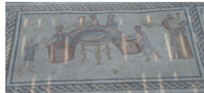
Abb. 3 Sigma-Mahl auf einem Bodenmosaik in einem Haus aus dem 3. Jh. n. Chr. in Sepphoris, Galiläa.