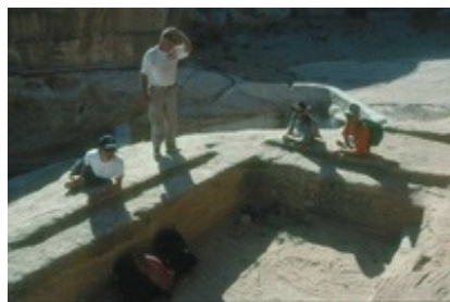
Abb. 2 Freiluft- triklinium in Petra, Jordanien.

Im NT finden sich sowohl festliche Mahlzeiten z.B. zu Geburtstagen und Hochzeiten