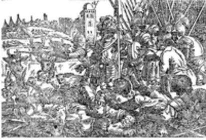
Abb. 2 David rettet Keila und erbeutet das Vieh der Philister (Holzschnitt; Lutherbibel, 1670).