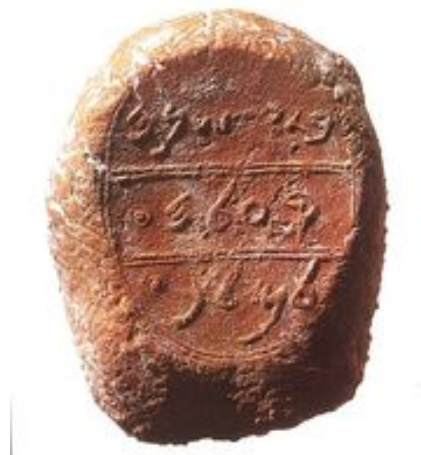
Abb. 6 Bulle mit Erwähnung Keilas.

Um das Jahr 2000 wurden über tausend hebräische Bullen bei illegalen Ausgrabungen in Chirbet Qīlā entwendet. Es handelt sich vor allem um Bullen aus der Zeit des Königs → Hiskija , sowie Bullen hoher Beamter am königlichen Hof (Deutsch 2012, 59). Die fiskalischen Bullen von Chirbet Qīlā belegen zum einen die Existenz von bislang außerbiblisch nicht erwähnten Orten, zum anderen die judäische Steuerverwaltung in der Schefela zur Zeit Hiskijas. Auf einer der Bullen von Chirbet Qīlā wird der Ortsname Keila genannt: „im 19. Jahr (von) Keila an den König“ (Deutsch 2003, 85-89).