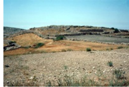
Abb. 5 Blick von Süden auf Chirbet Qīlā .

Während Edward Robinson die vermutlichen Überreste von Chirbet Qīlā lediglich als „verfallene Grundmauern“ bezeichnete (Robinson, 220), identifizierte C.W.M. van der Velde als erster den Ruinenhügel von Kīla mit dem biblischen Ort Keila (van der Velde, 328). Nach Victor Guérin ist die ursprüngliche Lesart dieses Ortes zudem Chirbet Kīlā (Guérin, 341). Der Ort Chirbet Qīlā liegt auf der Ostseite des Wādī ṣ-Ṣūr , westlich der Stadt Bēt Ūlā in der östlichen Schefela, ungefähr 13,5 km nordwestlich von → Hebron und 5 km südlich von → Adullam . Der Ruinenhügel Chirbet Qīlā befindet sich auf dem Ausläufer eines Hügelzuges, der nach Norden, Westen und Süden von der Umgebung stark isoliert und im Osten über einen Sattel mit dem fast gleich hohen Gelände verbunden ist. Der Hügel erhebt sich etwa 66 m über die Talsohle. Das Hügelplateau erstreckt sich auf eine Fläche von etwa 5 ha.