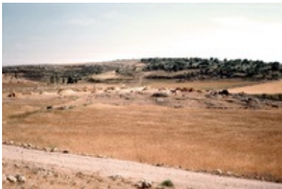
Abb. 4 Dreschplätze bei Chirbet Qīlā .

Als bislang unabhängige Stadt verwundert es nicht, dass Keila somit das Interesse der Philister und Israeliten auf sich zog.