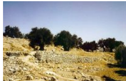
Abb. 9 Ĝebel er-Rumēde .

Die archäologisch nachweisbare Geschichte Hebrons beginnt in der Frühbronzezeit. Aus der Frühbronzezeit I (spätes 4. Jt. / frühes 3. Jt. v. Chr.) sind Grabfunde vom Ĝebel er-Rumēde belegt. In der Frühbronzezeit III (zweite Hälfte 3. Jt. v. Chr.) wurde erstmals eine massive Stadtmauer errichtet, von der auf dem Ĝebel er-Rumēde zwei Teilstücke von ca. 14 m und ca. 12 m nachgewiesen sind. In der Mittelbronzezeit II (18.-16. Jh. v. Chr.) wurde eine neue massive Stadtmauer angelegt, deren Verlauf etwas von der frühbronzezeitlichen Mauerführung abweicht. Die mittelbronzezeitliche Stadtmauer war mit Türmen und Vorsprüngen versehen. Sie ist heute noch stellenweise auf dem Gelände des Ĝebel er-Rumēde zu erkennen. Aus der Mittelbronzezeit stammt auch ein Keilschrifttäfelchen, das neben vier Personennamen eine Liste von Tieren enthält. Der Fund gehört zu den wenigen bisher in Palästina nachgewiesenen Schriftzeugnissen der Bronzezeit. Zusammen mit der massiven Stadtmauer weist er darauf hin, dass Hebron um die Mitte des 2. Jt.s v. Chr. eine wichtige Stadt war, vermutlich das Zentrum eines teilautonomen Stadtstaates, der größere Teile des zentralen judäischen Berglands umfasst haben dürfte. Aus der Spätbronzezeit (15.-13. Jh. v. Chr.) sind bislang nur Grabfunde nachgewiesen. Wahrscheinlich bestand auf dem Ĝebel er-Rumēde zu dieser Zeit keine dauerhaft bewohnte Siedlung.