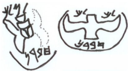
Abb. 11 Königsstempel. Vierflügliges Symbol (Skarabäus, links) und zweiflügliges Symbol (Flügelsonne) mit dem Ortsnamen „Hebron“ (jeweils unteres Register).

Ein städtisches Zentrum wurde Hebron erst wieder in der späteren → Eisenzeit II (8.-6. Jh. v. Chr.). Aus dieser Zeit wurden Wohngebäude vom Typ des Vierraumhauses freigelegt. Reparaturarbeiten an der mittelbronzezeitlichen Mauer sprechen dafür, dass die Mauer wieder als Stadtmauer fungierte.