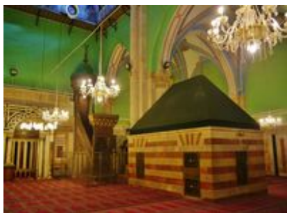
Abb. 3 Das sog. Grab Isaaks im muslimischen Teil des Haram el-Chalil .

Eine wichtige Rolle spielt Hebron und sein Gelände im Zusammenhang mit den Überlieferungen vom Familiengrab der Erzeltern. Nach dem Tod → Saras kommt Abraham aus Beerscheba ( Gen 22,19 ) nach Kirjat-Arba ( Gen 23,2 ). Zu dem Ortsnamen Kirjat-Arba wird als Erklärung hinzugesetzt „das ist Hebron“ ( Gen 23,2 ; vgl. Gen 35,27 ). Kirjat-Arba ist als eigenständiger Ortsname lediglich in Neh 11,25 belegt. Der Vers gehört zum Listenmaterial des → Nehemiabuchs , das die territorialgeschichtlichen Verhältnisse im