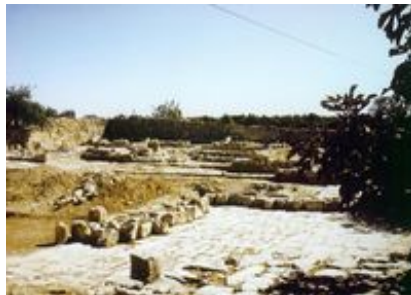
Abb. 8 Ausgrabungen auf Rāmet el-Chalīl (Blick nach Osten).

Hinsichtlich einer Gleichsetzung des Platzes mit dem