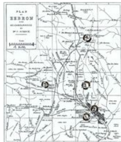
Abb. 4 Hebron und Umgebung nach einer Karte vom Ende des 19. Jh.s (1 Gebel er-Rumède , 2 Haram el-Chalīl , 3 Chirbet Nimrā , 4 Rāmet el-Chalīl , 5 Chirbet Sibte ).

Hebron liegt ca. 30 km südlich von Jerusalem im Zentrum des jüdischen Berglands auf einer Höhe zwischen 925 und 975 m ü.NN. (Koordinaten: 1605.1035; N 31° 31' 29" , E 35° 06' 39" ). Die jährlichen Niederschlagsmengen und die Bodenbeschaffenheit erlauben Landwirtschaft ohne künstliche Bewässerung. Neben dem Gelände um → Betlehem war die Region um Hebron im Altertum ein Zentrum landwirtschaftlicher Produktion in dem ansonsten nur schwer zu nutzenden Bergland. Bei Hebron wurden vor allem Öl und Wein produziert. Mehrere ergiebige Quellen in und um Hebron sicherten den Wasserbedarf der Bevölkerung. Auch verkehrsgeographisch lag Hebron zentral, da von hier aus Hauptwege