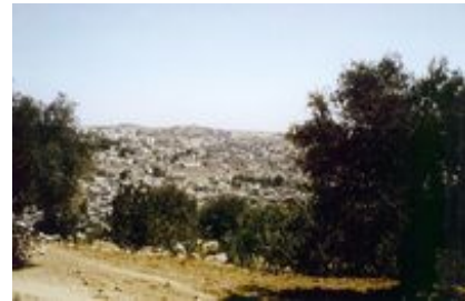
Abb. 5 Blick vom Ġebel er-Rumēde auf das Zentrum der heutigen Stadt Hebron ( el-Chalīl ) mit dem Gebäude der Machpela ( Ḥaram el-Chalīl ) im Zentrum.

In alttestamentlicher Zeit lag Hebron westlich der heutigen Stadt auf dem Abhang des Ġebel er-Rumēde (Koordinaten: 1597.1036; N 31° 31' 28", E 35° 06' 08" ). Dort wurden Reste einer Stadtanlage aus der Bronze- und Eisenzeit ergraben. In hellenistischer Zeit oder in römischer Zeit (2./1. Jh. v. Chr.) wurde die Siedlung ins Tal an die Stelle der heutigen Stadt (arab. el-Chalīl , Zentrum bei 1605.1035, N 31° 31' 29", E 35° 06' 39" ) verlegt.