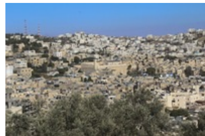
Abb. 2 Das Zentrum Hebrons mit dem unter Herodes gebauten Haram el-Chalil , der teils als Synagoge, teil als Moschee genutzt wird und in dem sich angeblich die Gräber der Erzeltern befinden.

In den → Erzeltern Erzählungen dient der Ortsname Hebron lediglich als geographischer Fixpunkt zur Erklärung der Lage von Mamre und Kirjat-Arba. In Mamre bzw. bei den „großen Bäumen Mamre“ (Luther: „Hain Mamre“) lässt sich → Abraham für längere Zeit nieder ( Gen 13,18 ; Gen 18,1 ), bevor er in den → Negev weiterzieht ( Gen 20,1 ). Die Angabe von Gen 13,18 , Mamre liege „in“ bzw. „bei Hebron“ (בְּחֶבְרוֹן bəḥævrôn ), ist am ehesten so zu verstehen, dass Mamre zum Territorium Hebrons gehörte. Die lokale Anbindung der Figur Abrahams an die Gegend von Hebron in Gen 13,18 und Gen 18,1 wird oft so gedeutet, dass dort die älteste Abrahamüberlieferung entstand. Allerdings ist Abraham auch im Negev in → Beerscheba ansässig (Gen 20-22; v.a. Gen 21,33 ; Gen 22,19 ). Daher ist eine primäre lokale Verhaftung der Abrahamfigur in bzw. um Hebron aus der Abrahamgeschichte in Gen 11,27-Gen 25,11 nicht eindeutig zu entnehmen.