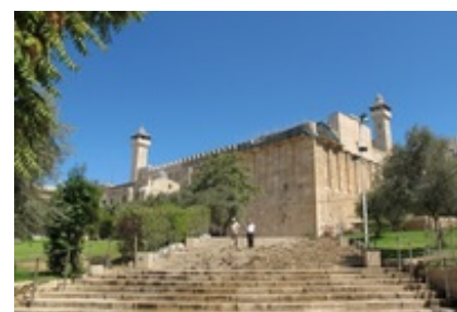
Abb. 6 Die Machpela ( Ḥaram el-Chalīl ).

Die tatsächliche Lage des in den Erzelternerzählungen genannten Feldes Machpela mit der gleichnamigen Höhle ist unbekannt. Das heute Machpela genannte Bauwerk (arab. Ḥaram el-Chalīl ) im Zentrum der modernen Stadt stammt in seinen Anfängen aus der Zeit des Herodes (37-4 v. Chr.). Der Bau war zunächst lediglich ein nicht überdachtes ummauertes Podium, das die Lokaltradition der Erzelterngräber markieren sollte. Nach literarischen Quellen scheint die Lokaltradition seit dem 3. Jh. v. Chr. an dem Platz des Ḥaram el-Chalīl zu haften. Ob es einen früheren lokalen Haftpunkt für die Machpela gab und wo dieser