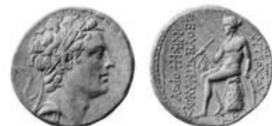
Abb. 4 Antiochus IV. Epiphanes.

Die Situation eskalierte 167 v. Chr. im Opferbefehl für Zeus und dem Verbot der Beschneidung, was auf heftigen Widerstand gesetzestreuer und nationalreligiöser Kreise stieß (vgl. 1Makk 1,51ff ). Die Offenheit griechischer Weltkultur und die Exklusivität jüdischer Religion und Tradition prallten im