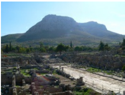
Abb. 11 Korinth - Lechaion-Straße und Forum im Hintergrund.

Die Stadt am Isthmos mit seinen großen Häfen (Lechaion und Kenchreai) war die bedeutendste und größte Stadt Griechenlands. Nach der Blüte in archaischer und klassischer Zeit (8.-4. Jh. v. Chr.) geriet der Stadtstaat seit dem 4. Jh. in Konflikt mit den Großmächten. Nach der Zerstörung durch die Römer (146 v. Chr.) wurde Korinth von Julius Caesar als römische Kolonie wieder aufgebaut (44 v. Chr.). Die Colonia Laus Iulia Corinthiensis war seit 27 v. Chr. Hauptstadt der neu gegründeten Provinz Achaia und Sitz des Prokonsuls. Im Jahre 51/52 n. Chr. hatte Lucius Iunius Gallio, ein Bruder des Philosophen Seneca, dieses Amt inne. Nach Apg 18,12-17 musste sich Paulus während seines Aufenthalts in Korinth vor ihm verantworten. Nach Ausweis der archäologischen Funde sowie der antiken Quellen (vgl. Pausanias, Descriptio Graeciae II 1,1-5,5) entwickelte sich die Stadt im 1./2. Jh. n. Chr. zu einem pulsierendem und weltoffenem Handelszentrum.