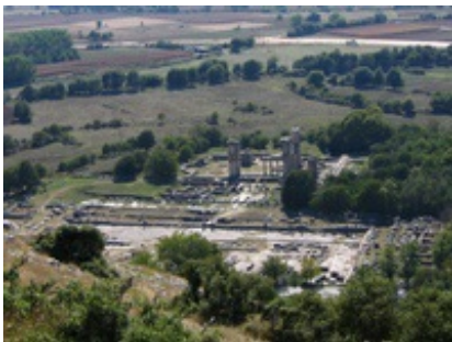
Abb. 7 Philippi - Römisches Forum.

Die Apostelgeschichte weiß von Konflikten mit der Stadtregierung ( Apg 16,20 ), von einer kurzen Verhandlung auf dem Forum ( Apg 16,19 : „Agora“) sowie von anschließender Inhaftierung und überstürzter Freilassung der Missionare (vgl. Apg 16,16-40 ). Die Erzählung um den Gefängniswärter scheint mit legendarischen Elemente ausgeschmückt.