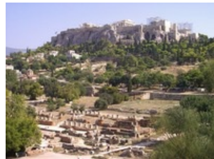
Abb. 10 Athen - Agora und Akropolis.

Lukas gestaltet den Besuch des Paulus in Athen durch die berühmte → „ Areopagrede “ zu einem literarischen Höhepunkt der 2. Missionsreise (vgl. Apg 17,16ff ). Umstritten ist die Historizität seiner Angaben. Die Diskussion des Apostels mit den Epikureern und Stoikern auf der Agora – dem traditionellen Ort sokratischen Gesprächs – könnte bewusste literarische Anknüpfung an Lokalkolorit sein (vgl. Apg 17,16-18 ). Ähnlich auch der Auftritt vor dem → Areopag als dem ehrwürdigem Gremium attischer Demokratie. Die dort gehaltene Rede des Paulus (vgl. Apg 17,21ff ) ist stark stilisiert, wengleich die Existenz von Altären für „unbekannte Götter“, an die die Rede anknüpft (vgl. Apg 17,23 ), durch die Reisebeschreibung des Pausanias (2. Jh. n. Chr.) belegt ist ( Descriptio Graeciae I 1,4).