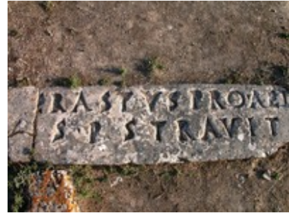
Abb. 12 „Erastus-Inschrift“.

Persönliche Anfeindungen, Spaltungen und andere innergemeindliche Probleme veranlassten Paulus im Jahre 55/56 n.Chr. zu weiteren Aufhalten in Korinth (vgl. Apg 20,3 ; 2Kor 10-13 : „Zwischenbesuch“). Von hier aus schrieb der Apostel auch den Römerbrief (vgl. Röm 15,22ff ; 16,1ff; 16,21ff). Den Fortbestand der christlichen Gemeinde bezeugt der um 95 n. Chr. verfasste Erste Clemensbrief.