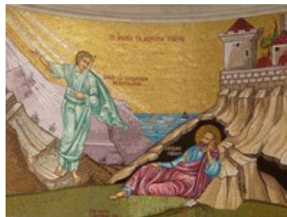
Abb. 6 Die Vision von Troas – Paulus-Denkmal in Veria.

Auf der Via Egnatia – der wichtigsten Ost-West-Verbindung zwischen Byzanz und Rom – gelangte Paulus nach → Philippi . Die Stadt gehörte zum ersten Bezirk der Provinz Macedonia (vgl. Apg 16,12 ) und war 42 v. Chr. nach der Niederlage der Cäsarmörder in der Schlacht von Philippi zur römischen Kolonie ernannt worden. Sie trug den Namen Colonia Iulia Augusta Philippensis (42-30 v. Chr. Colonia Victoria Philippensis ) und war Heimat für eine große Zahl ausgesiedelter Legionäre und italischer Siedler. Nach Ausweis der Inschriften war der Grad der Romanisierung hoch – die Lateinische Sprache und Tradition vorherrschend. Die alteingesessene Bevölkerung (Makedonen und Thraker) sprach Griechisch.