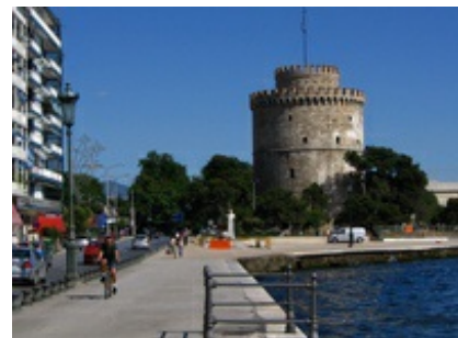
Abb. 8 Thessaloniki - Promenade und „Weißer Turm“.

In römischer Zeit (nach 148 v. Chr.) wurde Thessaloniki Hauptstadt der Provinz Macedonia und entwickelte sich zur größten Stadt Nordgriechenlands. Nach 42 v. Chr. zur civitas libera („Freistadt“) erhoben (vgl. Inscriptiones Graecae X 2,1 Nr. 6), behielt Thessaloniki die aus makedonischer Zeit stammenden Institutionen städtischer Selbstverwaltung wie Rat, Volksversammlung