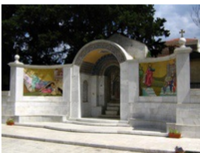
Abb. 9 Paulus-Denkmal in Véria.

Die relative Abgelegenheit (Cicero: In Pisonem 89: oppidum devium ) – abseits der Via Egnatia ohne Zugang zum Meer – und die bekannte Beschaulichkeit dürften nach den Vorfällen in Thessaloniki dazu beigetragen haben, dass Paulus und seine Begleiter Beroia als nächstes Ziel wählten (vgl. Apg 17,10 ). Wie in Thessaloniki bot auch hier die örtliche Synagoge den Anknüpfungspunkt für die paulinische Mission. Die Predigt des Evangeliums hat Erfolg. Apg 20,4a erwähnt später ein Mitglied der jungen Gemeinde mit Namen: Sopater aus Beroia, der zu den Begleitern des Paulus auf der dritten Missionsreise gezählt wird.