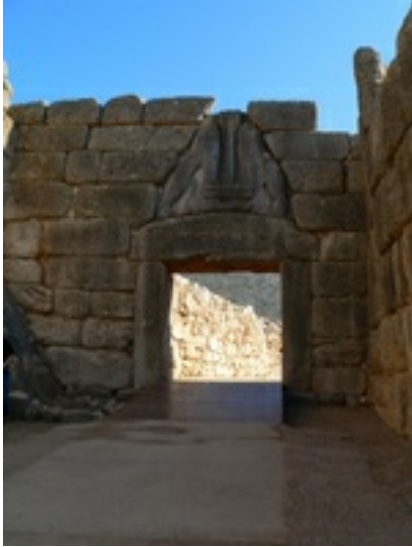
Abb. 1 Löwentor der Burganlage von Mykene

folgende Zeit (8.- 6. Jh. v. Chr.) und lassen die Idee eines großen Griechenlands entstehen ( Magna Graecia ). Innenpolitisch entwickeln sich in den Stadtstaaten des griechischen Mutterlandes Ansätze zu demokratischen Staatsformen, die – wie in Athen – den freien Bürgern (nicht den Sklaven und Frauen) eine Teilnahme an den politischen Entscheidungen ihres Gemeinwesens ermöglichen.