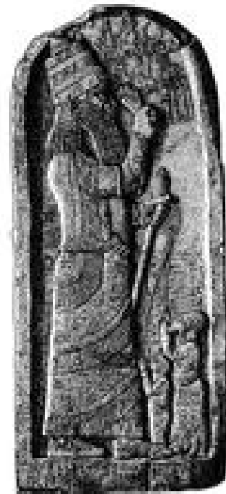
Abb. 4 Asarhaddon (681-669 v. Chr.) hält an zwei Bändern die besiegten Könige Taharqo von Ägypten und Balu von Tyrus (Stele aus Sindschirli).

repräsentierte Bereich der Anordnung wurde durch die Mauern einer Stadt von dem der Ordnung getrennt. Besiegte Herrscher mußten zum Zeichen der Niederlage und Unterwerfung häufig wie Wachhunde an Ketten die Tore von