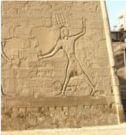
Abb. 3 Der Pharao packt die Feinde am Schopf und erschlägt sie (ptolemäischer Chnumtempel in Esna).

Als kämpferischer Krieger zog er gegen die menschlichen Feinde aus, die die Grenzen bedrohten (vgl. Schoske 1996, 6ff; Hornung 2. Aufl. 1993, 77ff), und bekämpfte diese; als Jäger ging er gegen die wilden Tiere, insbesondere Löwen, vor (vgl. Schoske 1996, 418ff; Hornung 2. Aufl. 1993, 155; Maul 1995, 399; → Jagd ).