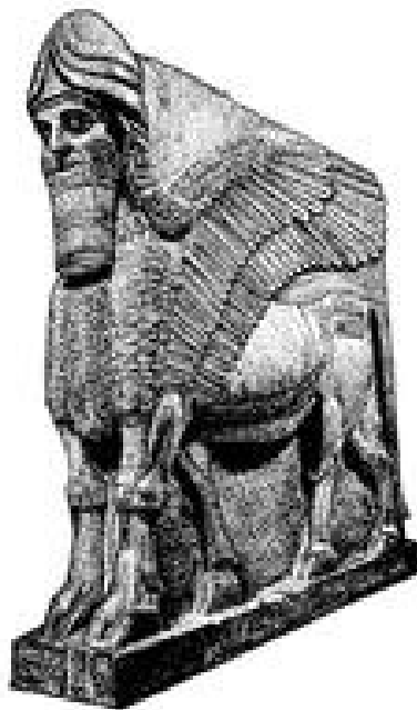
Abb. 6 Wächtertiere, die Elemente von Löwe, Adler und Mensch verbinden und 3,5 m hoch waren, standen am Eingang des Palastes Assurbanipals II. (883-859 v. Chr.) in Nimrud.