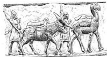
Abb. 2 Esel und Kamel als Transporttier.

Eines der ältesten Haustiere ist der vom nubischen Wildesel abstammende Hausesel ( Equus asinus asinus ; hebr. חמור chămô ; die Eselin heißt עתון âtôn , der Eselhengst עיר / עיר ‘ajir ; die griechische Bezeichnung lautet ὄνος onos ). Er wurde schon seit dem 3. Jt. und damit lange vor dem Kamel zum Transport von Lasten benutzt. Bedeutung hat er – im Vorderen Orient bis heute – nicht nur als Lasttier ( Gen 42,26f ; 1Sam 25,18 ; Ex 23,5 ), sondern auch als Reittier ( Ex 4,20 ; Ri 12,14 ; 1Sam 25,20 ; 2Sam 16,2 ), da er sich dafür selbst in schwierigem Gelände eignet (→ reiten ).