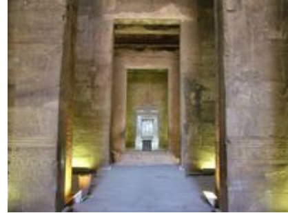
Abb. 8 Schrein im Sanktuar (A).

deutlich in den Ritualszenen des Sanktuars (A; Cauville 1987, 1-12). So finden wir dort eine Auswahl der Szenen, die zum traditionellen Kultbildritual gehören: Der König öffnet die Türe des Schreines, schaut das Bild des Gottes, bringt ihm Salbe und Gewänder. Auch sehen wir ihn beim Weihrauchopfer vor den beiden tragbaren Barken, in denen die Statuen des Horus und der Hathor ruhen. Sein vornehmstes Opfer im Sanktuar ist aber die Gabe der Maat (siehe 2.2.1). Dabei heißt es vom König, dass er dazu bestimmt ist, das Böse in diesem Lande zu beseitigen , und die hier ebenfalls anwesende Königin wendet sich an Horus Behedeti mit den Worten: Nimm es an aus seiner Hand, denn sein Herz ist richtig, und sein Dienst ist, die rechte Ordnung zu schaffen (Edfou I, 29, 8 und 10 f.).