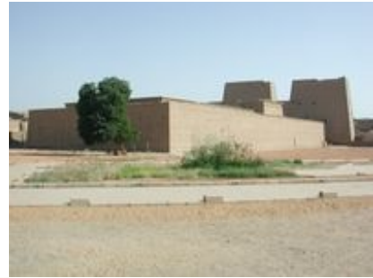
Abb. 4 Der Tempel von Edfu.

Die dritte Kategorie der Dekoration zielt nicht primär auf Gott oder König, sondern auf den Tempel selbst. Bei ihr handelt es sich unter anderem um