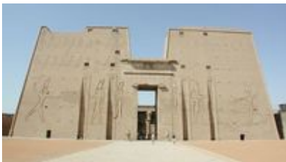
Abb. 7 Der Eingangspylon des Tempels von Edfu.

Nicht wenige Einheiten der Dekoration dienen dem umfassenden Schutz des Heiligtums. Da sind zum einen die großen Szenen des Niederschlagens der Feinde auf den beiden Pylontürmen, die jedem, der sich dem Haupteingang nähert, die Macht des ägyptischen Königs vor Augen führen, der ja nach dem Dogma Bauherr, erster Priester und Schutzherr aller Tempel war.