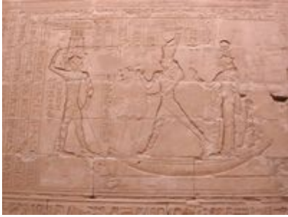
Abb. 9 Horus besiegt Seth.

Gegenspieler des Horus sind → Seth und Apophis. Beide haben, wie Horus, kosmische Größe, und beide bilden schier zahllose Hypostasen, um ihr unheilvolles Werk in der Welt durchzuführen. Seth erscheint in Edfu vor allem in den Gestalten eines Nilpferdes, eines Krokodils und eines Esels (Labrique 1993), Apophis zeigt sich in Gestalt einer Schlange. Wenn auch Seth und Apophis öfters gleichgesetzt werden, so verkörpern sie doch