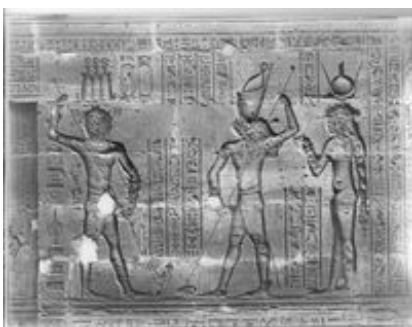
Abb. 5 Sieg des Horus über Seth und des Königs über Feinde.

Den Kultbetrieb des Tempels von Edfu reflektieren nicht nur die Opferszenen, sondern auch längere Szenenfolgen, die sich den großen Festen des Tempels widmen.