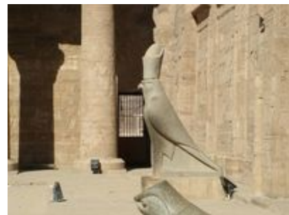
Abb. 6 Der Falke als Erscheinungsform des Horus von Edfu.

Anlass eines weiteren großen Festes war die alljährlich wiederholte Inthronisation des lebenden Falken, der als eine bedeutende Erscheinungsform des Horus von Edfu galt. Auf der Innenfläche des nördlichen Abschnitts der Umfassungsmauer (I') ist das Geschehen in Bild und Wort festgehalten: Eine Statue des Horus wurde zu mehreren lebenden Falken getragen und wählte einen von ihnen aus, indem die Träger es so einrichteten, dass sich die Statue dem betreffenden Falken zuneigte. Danach präsentierte man den Falken auf der Brücke zwischen den beiden Pylontürmen (K') und führte ihn zur Anerkennung durch Horus vor dessen Hauptkultbild im Sanktuar (A). Anschließend vollzog man die Riten der Inthronisation, wozu auch die Rezitation einer langen Litanei gehörte, in der die Göttin Renpet-nefret ( Vollkommenes-Jahr ) angerufen wurde, damit sie der Triade Edfus, also Horus, Hathor und deren Sohn, sowie dem lebenden Falken und dem König ein in allen Belangen glückliches neues Jahr gewährte (Kurth 1998, 229-242).