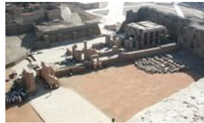
Abb. 2 Das Geburtshaus (Mammisi).

Dank ihres ausgedehnten Fruchtländes und einer verkehrsgünstigen Lage entwickelte sich die auf dem Westufer gelegene Stadt schon im Alten Reich zum Mittelpunkt des zweiten oberägyptischen Gaues. Noch heute erhebt sich als letzter sichtbarer Rest des antiken Siedlungsareals von Edfu ein sehr hoch anstehender Ruinenhügel westlich der heutigen Stadt. Zwischen dem Ruinenhügel und der heutigen Stadt liegt der Tempelbezirk, zu dem außer dem großen Tempel des Horus etliche weitere Gebäude gehörten. Von diesen hat sich das Mammisi relativ gut erhalten, ein in der Nähe des Haupttempels gelegenes Heiligtum, in dem die Geburt des Harsomtus (siehe 3.2) gefeiert wurde (Daumas 1958). Die Inschriften des Tempels nennen weitere Anlagen, so den heiligen See, kleinere Kapellen und Wirtschaftgebäude. Davon sind heute, wenn überhaupt noch etwas, nur noch einzelne Blöcke zu sehen. Der heilige See liegt unter den Häusern der modernen Stadt begraben; seine Freilegung ist geplant. Den heiligen Bezirk umgab einst eine hohe Lehmziegelmauer (Alliot 1954, Pl. IV).