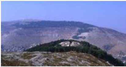
Abb. 1 Der Ebal vom Garizim aus gesehen.

Der Berg Ebal, Ġebel Islāmīje (Koordinaten: 175.182; N 32° 13' 59" , E 35° 16' 23" ; 938 m hoch), liegt nordwestlich von → Sichem , nördlich des Passes, der von Sichem nach Westen führt und an dessen Südseite sich der Berg → Garizim befindet. Er liegt damit an zentraler Stelle in Samaria, wo sich bei Sichem eine Ost-West-Straße und die Höhenstraße