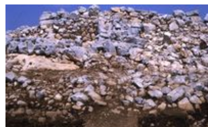
Abb. 4 Blick auf den sog. Altar; in der Mitte im Vordergrund die