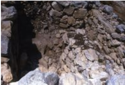
Abb. 5 Blick in einen der inneren Bereiche des sog. Altars, in dem sich Knochen- und Ascheschichten befanden.

verschiedenen, meist verbrannten hinaufführende Rampe. Tierknochen. Außerhalb des Gebäudes gab es ebenfalls Tierknochen und anscheinend mehrere Feuerplätze. Westlich des Hofes fand sich im Bereich B ein Haus von der Art eines Vierraumhauses, das eines der ältesten Exemplare dieses Typs wäre (und das als Indiz für Errichtung durch Israeliten interpretiert wird). Während das Gebäude im Bereich A als Heiligtum / Opferstätte gedeutet wurde, scheint das Haus im Bereich B das Wohnhaus des betreuenden Personals gewesen zu sein.