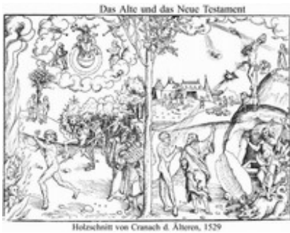
Abb. 6 Das Alte Testament bringt Gesetz und Tod, das Neue dagegen Leben und Auferstehung – allerdings durchbricht die Eherne Schlange (rechts) die klare Gegenüberstellung (Holzschnitt von Lucas Cranach, 1529).

Gegenüber den altkirchlichen und mittelalterlichen Auslegungstraditionen, die in den Ostkirchen auch gegenwärtig sehr viel stärker weiterwirkten, ergaben sich in den westlichen Kirchen mit dem Anbruch der Neuzeit radikale hermeneutische Umbrüche. Fünf geistesgeschichtliche Faktoren haben die Entwicklung einer modernen westlichen Hermeneutik vor allem bestimmt: