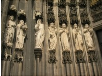
Abb. 10 Personen des Alten und Neuen Testaments in heilsgeschichtlicher Kontinuität: Adam, Noah, Mose, David, Elia, Joachim (Marias Vater), Johannes der Täufer und auf der gegenüberliegenden Seite: Eva, Abraham, Samuel, Salomo, Elisa, Anna (Marias Mutter), Josef. Im Zentrum zwischen beiden Türen des Portals steht Maria mit dem Jesuskind (Abb. 8; → Himmelskönigin Abb. 6) als Ziel der Geschichte (Haupteingang des Kölner Doms).

2.3. Heilsgeschichtliches Modell. Nach diesem Modell besteht die Relevanz des Alten Testaments darin, dass hier von Gottes Handeln in der Geschichte erzählt wird: Dieses Handeln und mit ihm die Geschichte laufen auf ein Ziel zu, nämlich Jesus Christus. Das Alte Testament stellt insofern die Voraussetzung des Neuen dar. Problematisch ist an diesem Modell z.B., dass das Alte Testament nicht nur aus Geschichtsbüchern besteht (→ Weisheit , → Psalmen , → Recht ) und dass von Gottes Handeln punktuell erzählt wird, es also nicht als eine kontinuierliche Linie erscheint.