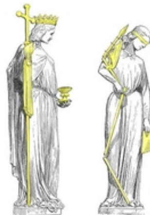
Abb. 1 Ekklesia und Synagoge – ein klassisches Beispiel für eine antithetische Leseweise: Die Synagoge erscheint als Jungfrau mit verbundenen Augen, gebrochener Lanze und zu Boden geworfener Krone, weil sie den Sinn des AT nicht erkennen würde und als auserwähltes Volk von der Kirche substituiert worden sei, die allein in Christus den wahren Sinn des AT vom NT her aufschließen und so triumphieren könne (Südportal des Straßburger

Biblische Theologie arbeitet somit auf drei Ebenen: a) historisch als exegetische Forschung an den in der Bibel enthaltenen Schriften, vor allem zu den traditions- und motivgeschichtlichen Zusammenhängen von Hebräischer Bibel, Septuaginta und christlichem Neuen Testament, b) in systematisch -theologischen Reflexionen über eine der Bibel gemäße Theologie (unter Einbeziehung der vielgestaltigen Antworten,