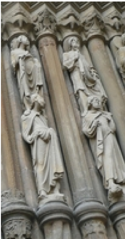
Abb. 2 Das Neue Testament steht auf den Schultern des Alten – Beispiel für eine Leseweise, die das Alte Testament als Grundlage wertschätzt (Bamberger Dom, um 1235).

Es gibt eine umfangreiche Literatur zu den religionshistorischen Verbindungslinien, die sich aus alttestamentlichen Wurzeln ins Neue Testament erstrecken. Diese überaus reichen, das Verständnis des Neuen Testaments ungeheuer vertiefenden Studien richten sich auf Großkonzepte (z.B. → Tun-Ergehen-Zusammenhang , → Sühne , → Königtum Gottes , Vorstellungen vom wahren Gottesvolk), auf maßgebende Personen (wie → Abraham , → Mose , → David , → Salomo ) oder auf alle möglichen sprachlichen, archäologischen oder lebensweltlichen Details (etwa die Bedeutung des Alkohols oder der rituellen Waschungen). Die Beurteilung des Einflusses des Judentums auf das entstehende Christentum unterliegt forschungsgeschichtlich erheblichen Schwankungen. Es gab Phasen und Weltgegenden, in denen man das Neue Testament oder doch Teile daraus geradezu als Teil der Religionsgeschichte Israels und des Judentums und als direkte und ungebrochene Fortsetzung des Alten Testaments begriff