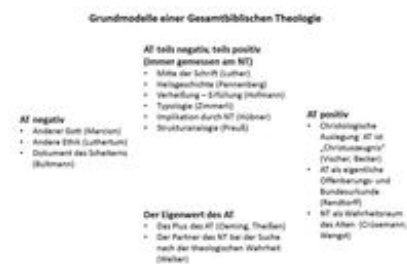
Abb. 7 Grundmodelle einer Gesamtbiblischen Theologie.

Die Frage nach der inneren Struktur der Bibel aus zwei Teilen spielt in allen Bereichen der materialen Dogmatik eine weichenstellende Rolle. Man kann vier Grundtypen eines dogmatischen Vorverständnisses unterscheiden, das zu jeweils völlig verschiedenen Modellen einer Gesamtbiblischen Theologie führt: Modelle, die das Alte Testament negativ sehen, Konzepte, die das Alte Testament teilweise positiv, teilweise negativ sehen, Entwürfe, die das Alte Testament eindeutig positiv sehen und Denkansätze, die