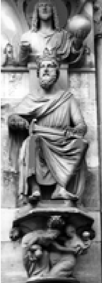
Abb. 4 Salomo und Jesus mit den Huren: Modell einer Typologie: Salomo ist zwar schon ein guter, weiser König, dem die Armen, konkret die Huren und ihre Kinder, am Herzen liegen, aber Jesus ist der Weltenrichter, dem die Macht über den Kosmos gegeben ist und dem Engel assistieren (im Südportal des Straßburger Münsters).

Lesarten festgelegt: Das Alte Testament ist Weissagung auf Christus, ist Ruf zum Gehorsam gegenüber Gottes Willen. Christologie und Ethik wurden zu den Hauptkategorien, wie das Alte Testament