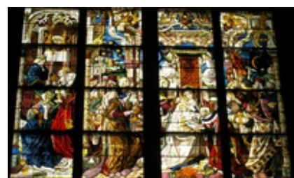
Abb. 5 Der Besuch der Königin von Saba bei Salomo wird als „Vorabschattung“ des Besuchs der Hl. Drei Könige bei der Geburt Jesu verstanden (Fenster in der Nordwand des Kölner Doms).

Allerdings hat sich die Kirche dabei dauerhaft auf bestimmte