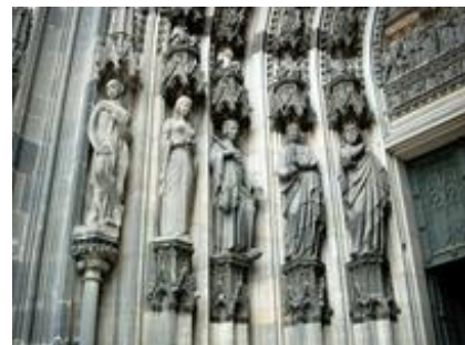
Abb. 9 Das Alte Testament als „Vorabschattung“ des Neuen: fromme Ausländer und Könige verweisen auf die Hl. Drei Könige: Hiob – Königin von Saba – Hiskia – Baltasar – Caspar und auf der gegenüberliegenden Seite: Melchisedek (König von Salem) – Witwe von Sarepta – David – Josia – Melchior (Drei-Königs-Portal des

2.2. Typologisches Modell. Dieses Modell will die Texte des Alten Testaments in ihrer ursprünglichen Aussageabsicht zu Wort kommen lassen und zeigen, dass es im Blick auf Gottes Handeln, aber auch auf Glauben, Zweifeln und Hoffen der Menschen zwischen Altem und Neuem Testament Struktur analogien gibt, z.B. dass sich Gott im Exodus- wie im Kreuzesgeschehen als rettender Gott erweist. Das Alte Testament bietet insofern Vorabschattungen des Neuen (→ Gerhard von Rad ). Auch an diesem Modell wird kritisiert, dass das Neue Testament im Grunde nichts Neues über Gott offenbart. Zudem wird kritisch gefragt, welchen Wert