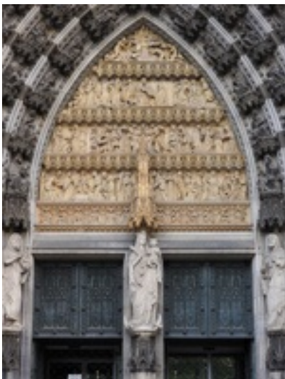
Abb. 8 Aus dem Alten Testament werden Sünde und Gesetz als Thema ausgewählt und dem Neuen Testament antithetisch gegenübergestellt (1.-2. Reihe: Sündenfall; Sintflut – Gesetz des Mose – Goldenes Kalb; 3.-4. Reihe: Verkündigung – Jesu Geburt – Darbringung; 12jähriger lehrt im Tempel – Taufe – Bergpredigt;

Vereinfacht lassen sich folgende Modelle unterscheiden: