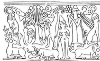
Abb. 2 Von Capriden flankierter Baum als Symbol von Fruchtbarkeit und Leben (Rollsiegel aus Megiddo; 14. Jh. v. Chr.).

Der Lebensbaum taucht altorientalisch in verschiedenen Varianten auf, wenn auch nicht direkt unter der expliziten Terminologie „Lebensbaum“. Einerseits – unter der Leitidee „Baum“ – ist er eng verwandt mit dem altorientalischen → Weltenbaum , der auch in Ez 29,11-19 ; Ez 31,2-12 und im aramäischen Text von Dan 4 greifbar ist, bzw. mit den diversen Heiligen Bäumen, die biblisch und