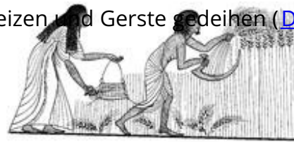
Abb. 2 Erntearbeiten (Wandmalerei im Grab des Sennudjem in Dēr el-Medīna , 19. Dynastie).

In Palästina, das als Land bezeichnet wird, wo Weizen und Gerste gedeihen ( Dtn 8,8 ; Rut 2,23 u.ö.; → Hirse und Dinkel spielten eine geringe Rolle, Jes 28,25 ; Ez 4,9 ), erwirtschaftete der Feldbau von Getreide und Hülsenfrüchten (Linse, Saubohne und Kichererbse; vgl. Gen 25,29f ; 2Sam 17,28 ; Ez 4,9 ) die Grundnahrungsmittel. Auf den weniger geeigneten Hanglagen wurden zumeist im Misanbau (vgl. Ps 128,3 ; Hhld 6,11 ) Oliven, Feigen und Wein angebaut ( Ri 9,8f ). Als Fruchtbäume befanden sich u.a. der Granatapfelbaum, Mandelbaum, Nussbaum, Johannisbrotbaum, die Pistazie, Sykomore und in Oasen wie Jericho die Dattelpalme in Kultur.