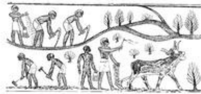
Abb. 1 Pflügen und Säen (Grab des Nacht in Theben, 18. Dynastie)