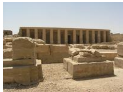
Abb. 4 Der Osiristempel von Sethos I.

Durch zwei überdachte Säulensäule gelangt man zu insgesamt sieben nebeneinander liegenden Sanktuaren (für Osiris, Isis und Horus, die Reichsgötter Amun-Re, Re-Harachte und Ptah sowie für Sethos I.). Das Heiligtum für Osiris ist um eine Raumfolge erweitert, die für die Festspiele genutzt worden sein könnte. Der Tempel besitzt als weitere Besonderheit einen sich südlich anschließenden Trakt, der u.a. Räume für den Gott Sokar enthält und in einer Galerie die Königsliste wiedergibt, in der Herrscher von der Reichseinigung bis zu Sethos I. namentlich aufgeführt werden. Hinter dem Tempel ist das sogenannte Osireion gelegen, das gemeinhin als Kenotaph für Sethos I. angesprochen wird, vornehmlich aber als Osirisgrab aufzufassen ist (Abb. 3 und 5).