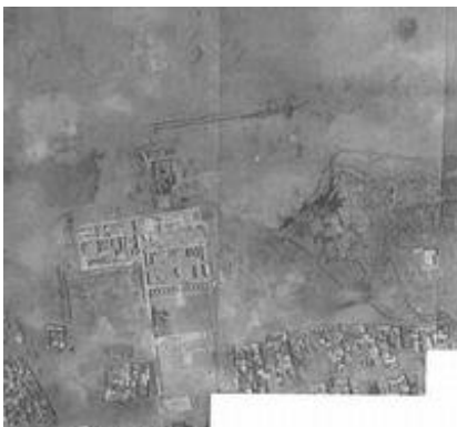
Abb. 3 Der Osiristempel von Sethos I. mit dem Osireion.

Der als Mittelfriedhof bezeichnete Abschnitt der abydenischen Nekropole, Abb. 2 (3), ist vornehmlich als privater Friedhof von prähistorischer Zeit bis zur 1. Zwischenzeit genutzt worden, danach vom Neuen Reich bis in römische Zeit. Es sind dort zudem Tierbestattungen vorgenommen worden. Die nordöstliche Ausdehnung des Mittelfriedhofes ist heute überbaut. Südlich hinter dem Tempel von Sethos I., Abb. 2 (5), und wahrscheinlich im Norden davon fanden sich Siedlungsreste aus spät-prädynastischer Zeit.