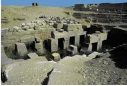
Abb. 5 Blick in das Osireion am Osiristempel von Sethos I.

Das Innere des (ursprünglich überdachten) Osireions ist als künstliche Insel gestaltet, die von einem Wassergraben umgeben ist. Er wird von dem Kanal gespeist, der (unterirdisch) bis zum Nil reicht. Tempel wie auch Osireion könnten in die Festspiele vor Ort mit einbezogen worden sein.