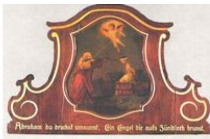
Abb. 11 Opferung Isaaks (Gemälde von „Pater Apotheker“; 1710).

Weitere Einzeldarstellungen finden sich in den Mosaiken von Ravenna (v.a. San Vitale; 6. Jh.), in den Bronzetüren von St. Zeno, Verona (mit einer Krücke als Greis typisiert), im Altar von Verdun und den Fresken von Saint Savin, Poitou (12. Jh.) sowie in den Bronzetüren des Florentiner Baptisteriums von Ghiberti (15. Jh.).