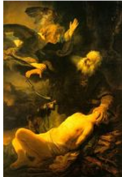
Abb. 6 Abraham und Isaak (Rembrandt; 1634).