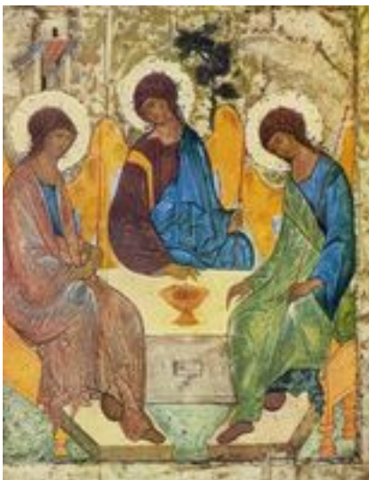
Abb. 5 Abrahams Gastmahl und die „Alttestamentliche Dreifaltigkeit“ (Ikone von Andrej Rubljew; um 1425).

Dieser Bund mit Abram, der in Gen 17 sowohl durch die Wiederholung der Verheißungen als auch durch die Beschneidung als Bundeszeichen eine Bestätigung erfährt, wird in der späteren Geschichte des Volkes Israel mit Gott und in der gesamten biblischen und außer- bzw. nachbiblischen Argumentation zu einem entscheidenden Faktor. Schon bei Isaak ( Gen 26,3 ) und am Ende des Buches Genesis ( Gen 50,24 ) wird der Bund zu einem → Eid gesteigert. Unterstützt wird die ausdrückliche Intervention Gottes durch die Umbenennung Abrams in Abraham ( Gen 17,5 ; reflektiert in 1Chr 1,27 und Neh 9,7 ; Analogien dazu sind die Umbenennungen von Sarai in Sara, Gen