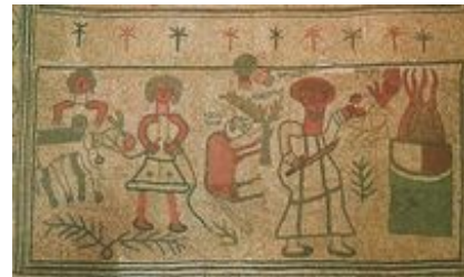
Abb. 12 Bindung Isaaks (Fußbodenmosaik in der Synagoge von Bet Alfa; 6. Jh.).

Die Seligen in Abrahams Schoß (vgl. Lk 16,22 ) begegnen in plastischer Darstellung an mehreren gotischen Kathedralen (Paris, Rheims, Bourges, Bamberg [Abb. 7], Baseler Münster). Unter den modernen jüdischen Malern war vor allem Marc Chagall vom Leben Abrahams fasziniert.