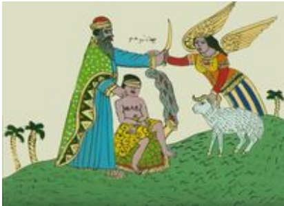
Abb. 9 Opferung Isaels (anonyme Hinterglasmalerei aus Tunesien; 20. Jh.).

Abrahams. Mohammed greift die alte Tradition auf, dass Ismael zusammen mit Abraham das Heiligtum der Ka'ba gründete (Sure 2,124-130). Im Weihegebet schließt Abraham die Bitte um die Sendung eines Propheten an die Araber ein (Sure 2,129), was auf Mohammed angewendet wird. Die Ka'ba gilt als erstes Gotteshaus, ihr Ort als der heilige Platz Abrahams (Sure 3,96-97).