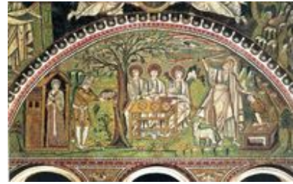
Abb. 10 Abrahams Gastmahl und Opferung Isaaks (Mosaik in San Vitale in Ravenna; 6. Jh.).

Abrahams Gestalt und Geschichte inspirierte vor allem die bildende Kunst. Szenen aus seinem Leben wurden in Gemälden, Skulpturen, Buchmalereien und Mosaiken dargestellt. Meist erscheint Abraham als weißbärtiger alter Mann mit einem Messer. Die wohl älteste erhaltene Darstellung Abrahams als Empfänger der Verheißung findet sich in der Synagoge von Dura Europos (3. Jh.; Abb. 1). Ganze Abraham-Zyklen finden sich in den Mosaiken der Kathedrale San Marco in Venedig (12. Jh.) und den flämischen Wandteppichen von Bernard von Orley (16. Jh.). Bekannte Einzelszenen begegnen in den Mosaiken von Santa Maria Maggiore in Rom (5. Jh.) und in den berühmten Buchmalereien der „Wiener Genesis“ (6. Jh.; jeweils als weißhaariger älterer Mann; Abb. 4).