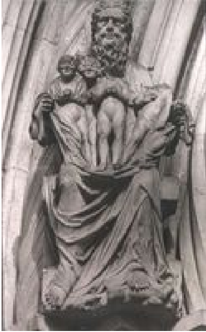
Abb. 7 Menschen in Abrahams Schoß (Bamberger Dom; um 1230).

In etwas anderer Akzentuierung gilt Abraham neben Isaak und Jakob als „bei Gott lebende Person“. Die bekannte Wendung „der Gott Abrahams, Isaaks und Jakobs“ wird als Argument für die Auferstehung der Toten herangezogen, denn Gott sei ja kein Gott von Toten, sondern der Lebenden (vgl. Mt 22,32 / Mk 12,26 / Lk 20,37 , ferner 4Makk 7,19; 16,25). In der lukanischen Beispielerzählung vom armen Lazarus und vom Reichen ( Lk 16,22-31 ) fungiert Abrahams Schoß als Chiffre für die ewige Glückseligkeit (dass die Patriarchen im Jenseits die Toten empfangen, spiegelt sich auch in 4Makk 13,17 wider). Abraham kann mit dem Reichen in der Unterwelt zwar reden, aber der trennende Graben ist unüberwindbar. Die paränetische Absicht des Lukas, seine wohlhabenden Adressaten mit