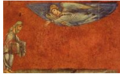
Abb. 4 Abraham als der Empfangende (Wiener Genesis; 6. Jh.).

Volkes Israel, das allein JHWH verehren wird, in der Abraham-Geschichte vorweggenommen wird. Während verschiedener Episoden im Leben Abrahams wird immer wieder die besondere Beziehung Gottes zu Abraham hervorgehoben: Die Verheißungen werden wiederholt und verstärkt, etwa durch Bilder wie die Sterne am Himmel: „So zahlreich werden deine Nachkommen sein“ ( Gen 15,5 ) – und darauf fällt der Satz „Abram glaubte JHWH, und er rechnete es ihm als Gerechtigkeit an“ ( Gen 15,6 ). Dieser Vers wird im Neuen Testament als Rechtfertigung Abrahams aus Glauben (noch vor dem Akt der → Beschneidung ) eine sehr wichtige Rolle spielen, insbesondere bei Paulus. In Gen 15 werden die Verheißungen Gottes und die Glaubensantwort Abrams in einen → Bund mit z.T. archaisch anmutenden Ritualen gekleidet.